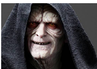
Záhadný a nepoučitelný Palpatine